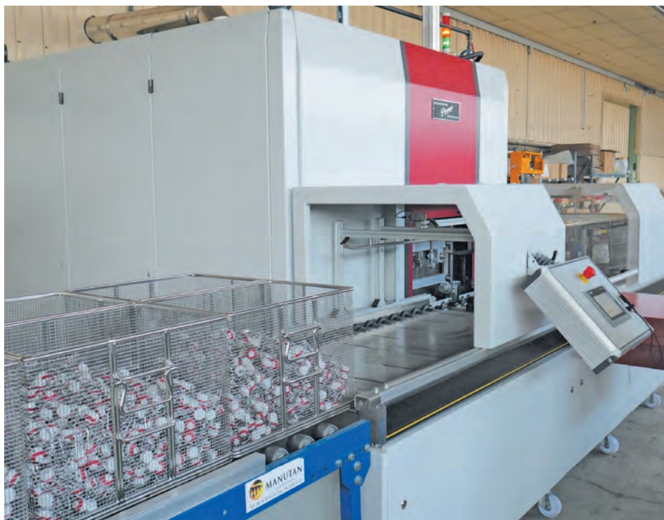
› Lavage multi-matières sur machine Neptun de Pero, une technologie lessivielle

tomatisé, le système de commande numérique permet la programmation de cycles personnalisés de nettoyage : rotation ou cycle pendulaire des paniers, température et distribution des bains, circuit de séchage et aspiration de vapeur... il suffit à l'opérateur de sélectionner le programme en fonction de la