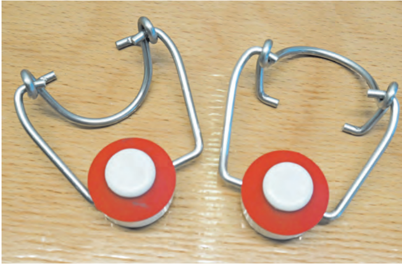
› Pièce avec caoutchouc, PVC sérigraphié et métal

famille de pièces concernées. Pour chaque charge, la chambre de travail reçoit un ou deux paniers de pièces, selon le volume à traiter. Les bains sont changés en moyenne toutes les 650 000 pièces.